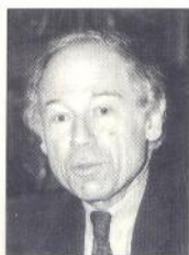
François Terré, Agrégré des facultés de droit, Professeur à l'Université Panthéon-Assas (Paris II). Membre de l'Institut.