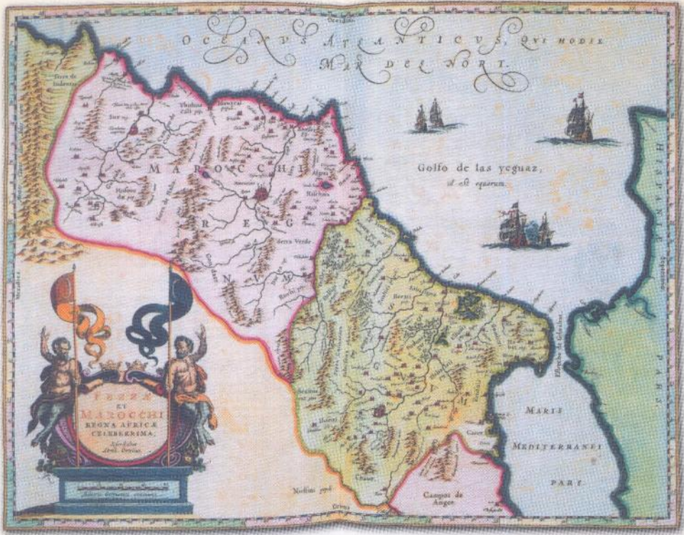
Atlas Maior 1665 , Les très célèbres Royaumes Africains de Fez et du Maroc, tels qu'Abraham Ortelius les a décrits.

En 987, quand Hugues Capet monte sur le trône de France, l'État marocain a déjà deux siècles d'existence.