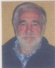
est directeur de recherches à l'IRD