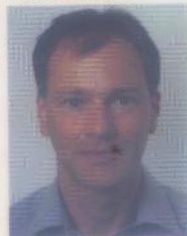
est journaliste scientifique